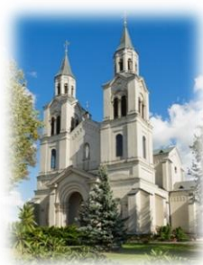
Vilkaviškio Švč. M. Marijos apsilankymo parapija

Vilkaviškio dekanato šeimos centras atstovauja Vilkaviškio vyskupijos šeimos centrui Vilkaviškio dekanate, kartu organizuoja renginius, rengia sužadėtinius, rūpinasi vaikų ir jaunimo sielovada, lytiškumo ugdymu bei rengimu šeimai.